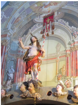
Christus, der Auferstandene (Maria Plain)

Die Vesper (vesper, lateinisch: der Abend) ist das Abendgebet und Teil des kirchlichen Stundengebetes , das den Tag vom Morgen bis zur Nacht in verschiedene Gebetszeiten gliedert. Zu einer Vesper gehören u. a. Wechselgesänge (vor allem die Psalmengebete aus dem Alten Testament), eine kurze Lesung aus der Bibel sowie Gebete und Fürbitten.